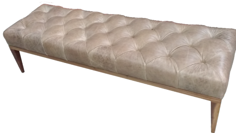
PIE DE CAMA