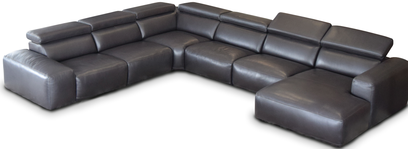
SILLÓN BRAZO DERECHO / IZQUIERDO