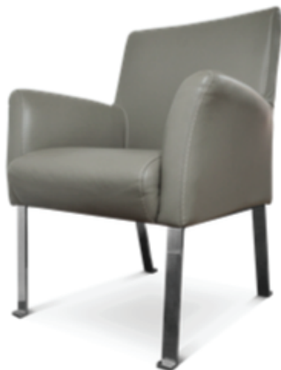
SILLA CON BRAZO